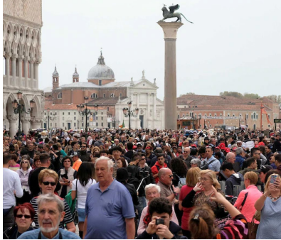
Abb. 2: Massentourismus in Venedig

Die folgenschweren Auswirkungen des Massentourismus werden an Beispielen wie Venedig immer deutlicher. Trotzdem wollen Städte rund um die Welt immer noch mehr und mehr Tourist:innen anlocken. Wer sich um die Nachhaltigkeit seiner Reise kümmert, muss fast immer mit höheren Kosten rechnen, was vor allem für junge Menschen oft ein Problem ist. Daher habe ich mich mit folgender Fragestellung beschäftigt: