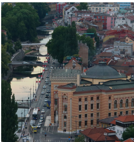
Abb. 3: Blick auf Sarajevo