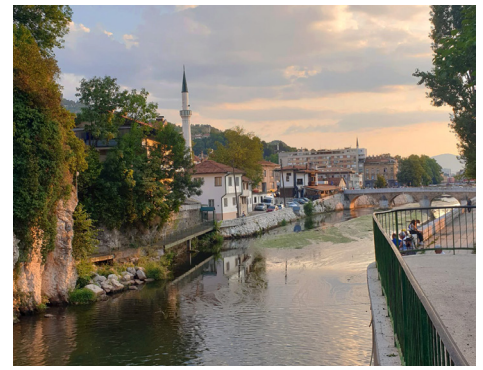
Abb. 1: Fluss in Sarajevo